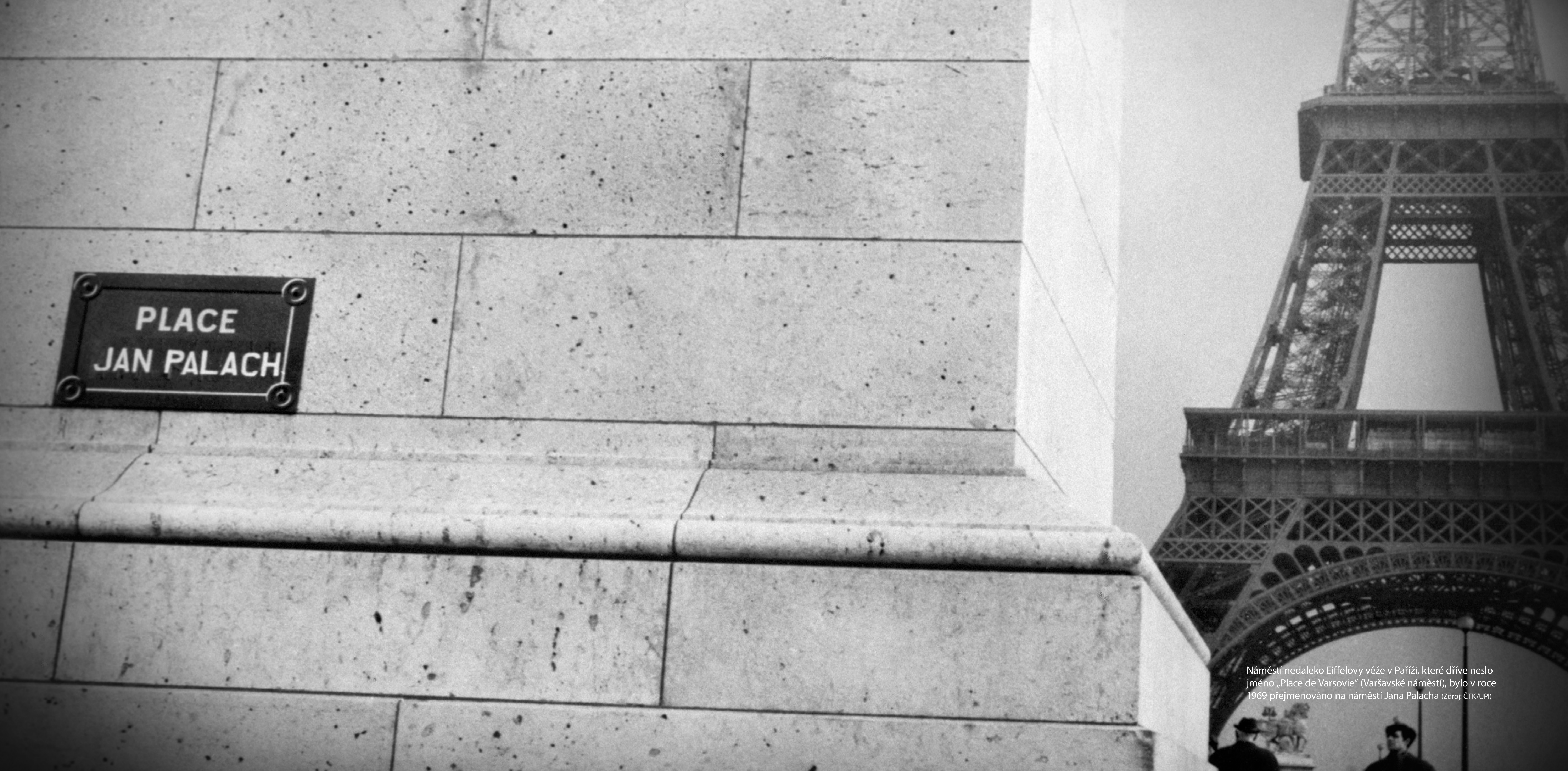
Náměstí nedaleko Eiffelovy věže v Paříži, které dříve neslo jméno „Place de Varsovie“ (Varšavské náměstí), bylo v roce 1969 přejmenováno na náměstí Jana Palacha