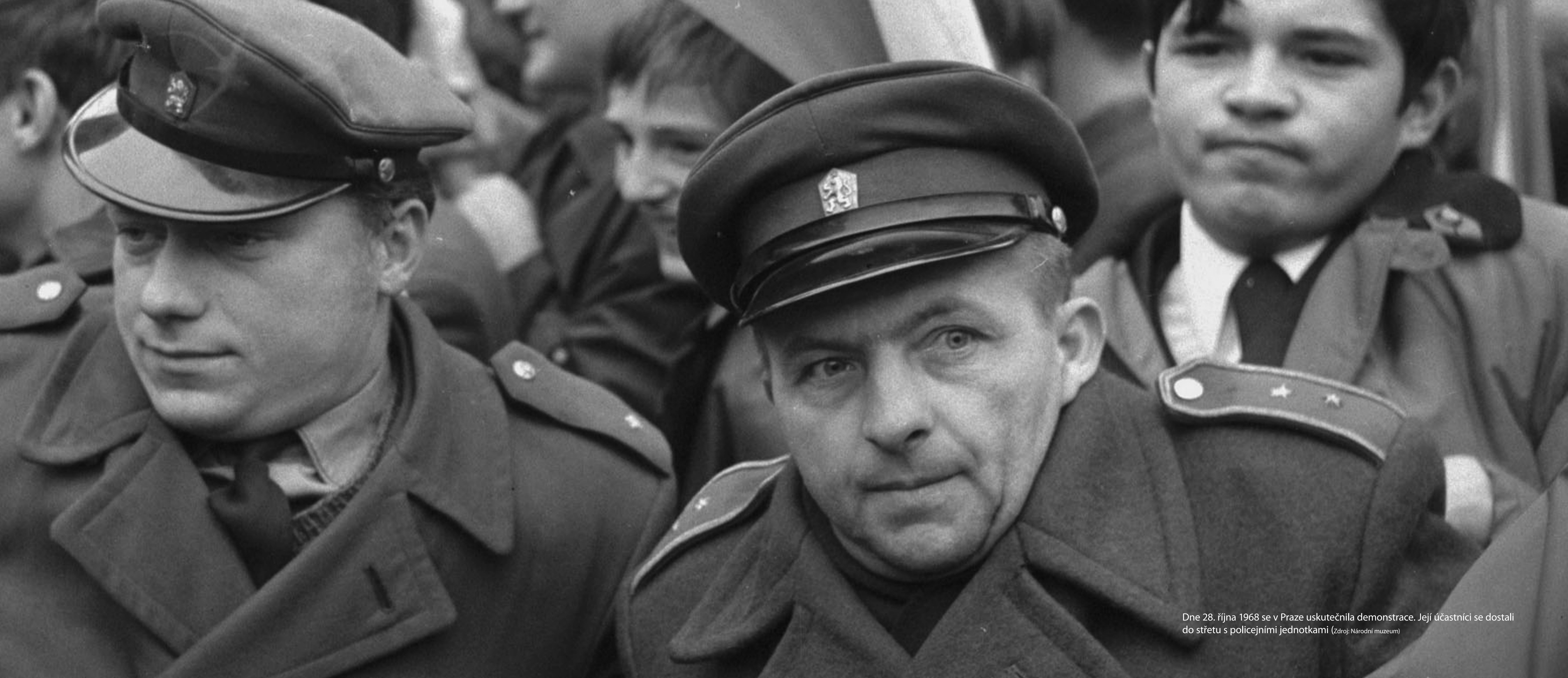
Dne 28. října 1968 se v Praze uskutečnila demonstrace. Její účastníci se dostali do střetu s policejními jednotkami