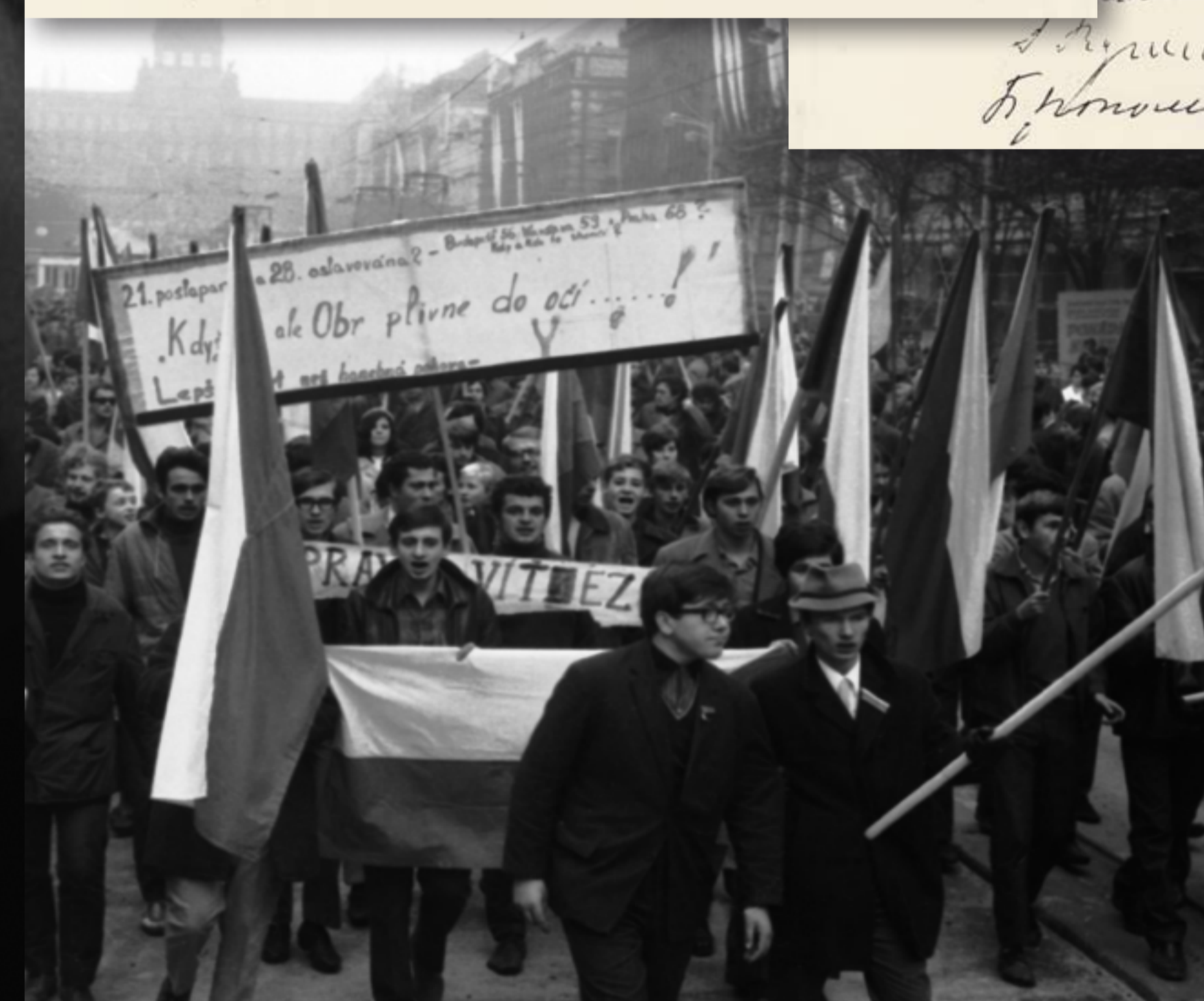
Na pražské demonstraci 28. října 1968 bylo zadrženo 77 osob. Při následující demonstraci ve dnech 6. a 7. listopadu 1968 bylo v hlavním městě zadrženo již 167 osob. V těchto dnech proběhly demonstrace také v Brně a Českých Budějovicích