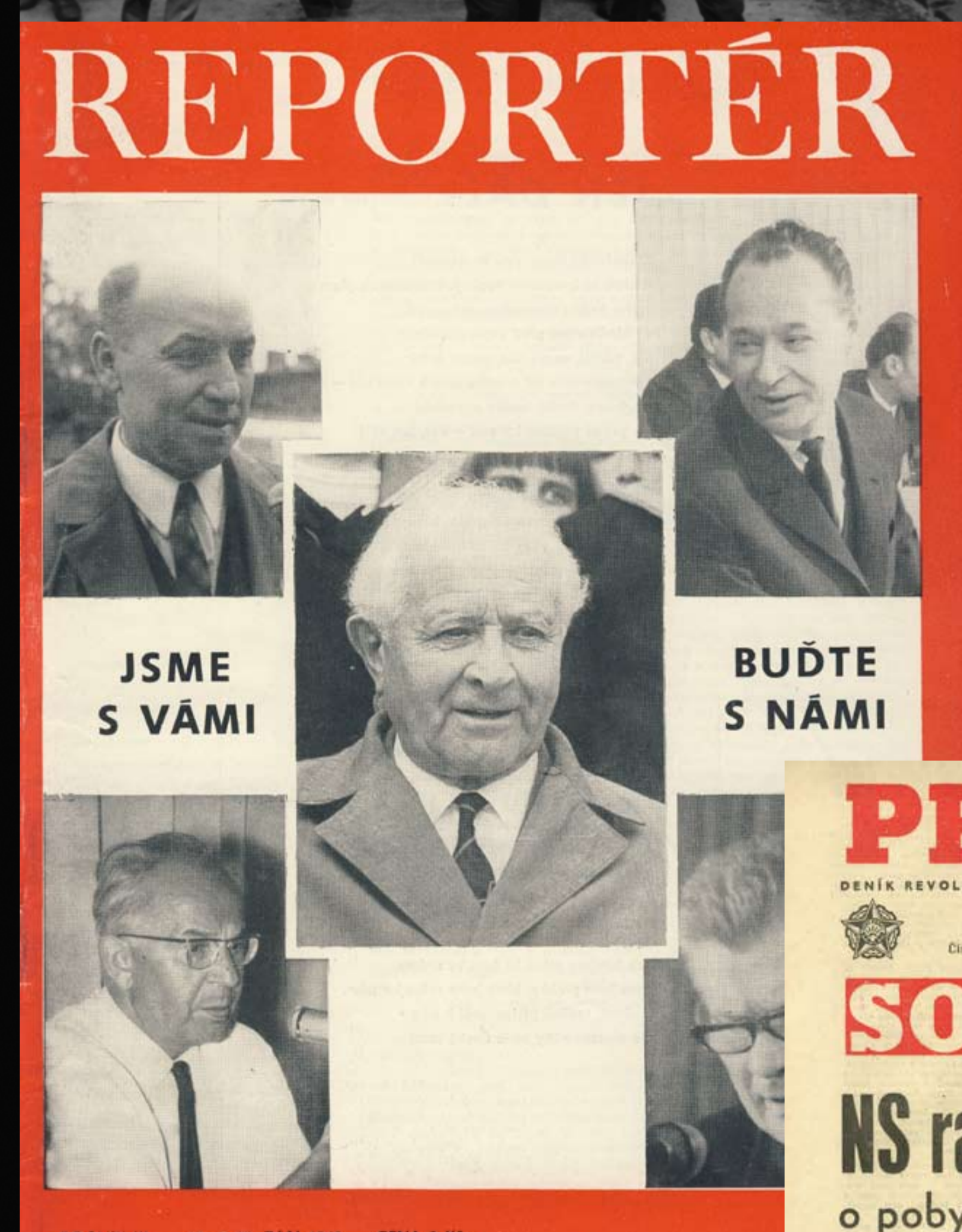
Dne 8. listopadu 1968 bylo na jeden měsíc zastaveno vydávání „příliš kritického“ týdeníku Reportér. Obálka z 18. září 1968: Zlevého horního rohu – Oldřich Černík, Alexander Dubček, Josef Smrkovský a Gustáv Husák, uprostřed prezident Ludvík Svoboda