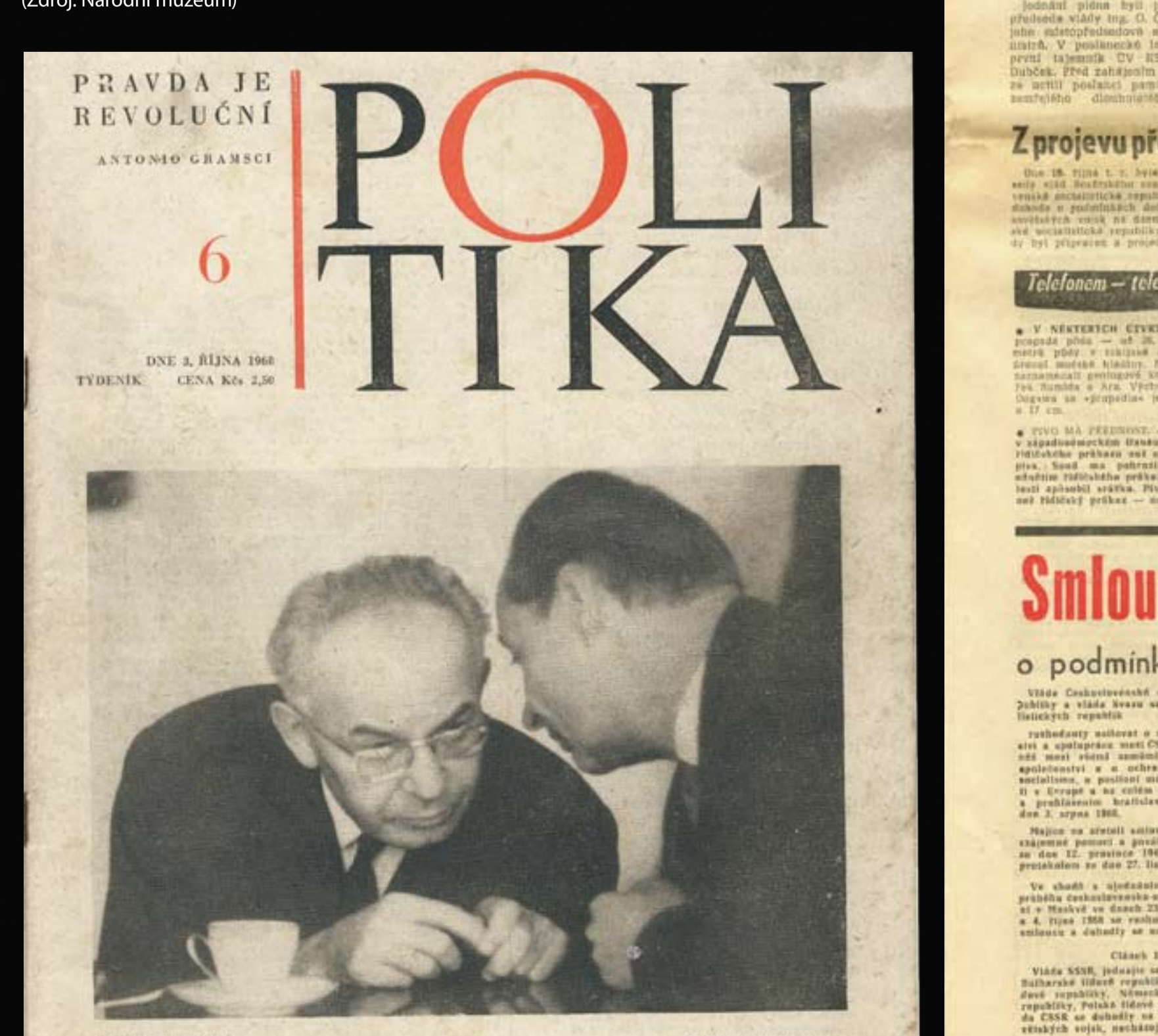
Časopis Politika byl zastaven zároveň s Reportérem. Na obálce z 3. října 1968 Gustáv Husák (vlevo) a Alexander Dubček