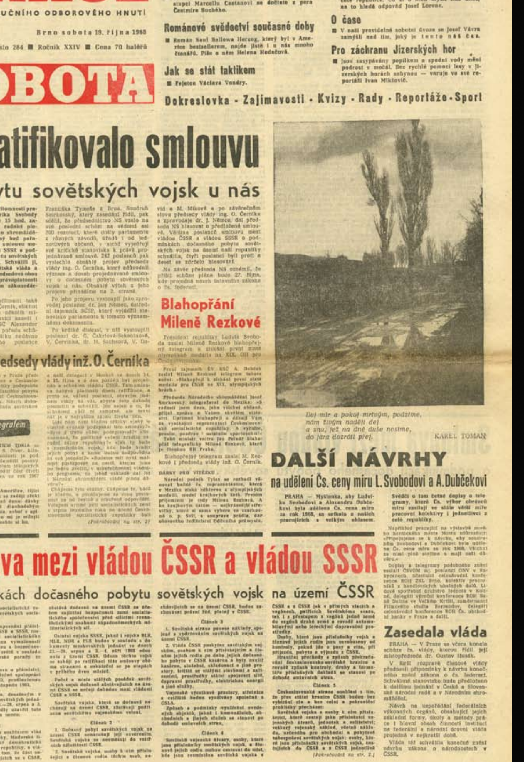
Titulní strana deníku Práce z 19. října 1968 se zprávou o ratifikaci smlouvy o dočasném pobytu sovětských vojsk