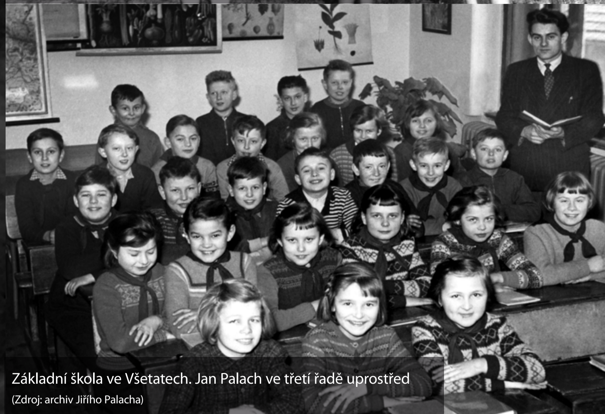
Základní škola ve Všetatech. Jan Palach ve třetí řadě uprostřed