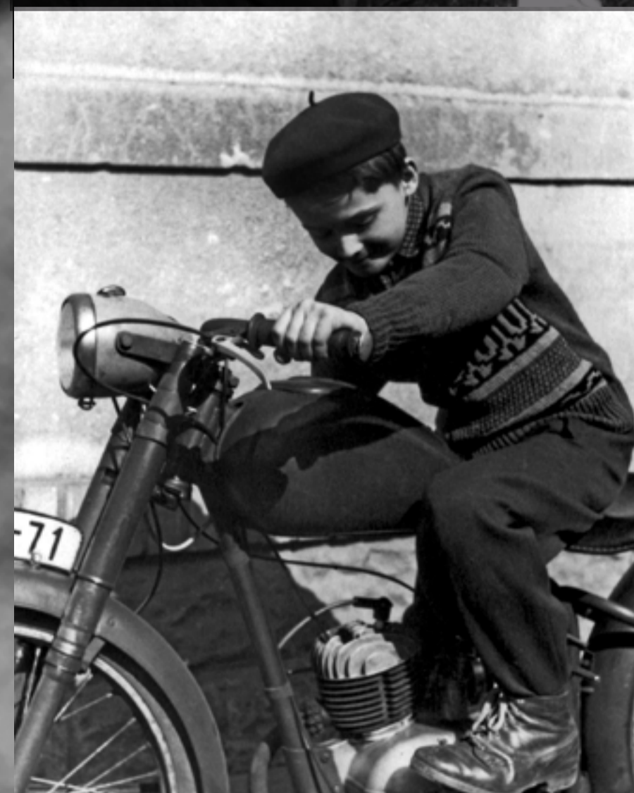
Jan Palach na motorce bratra Jiřího