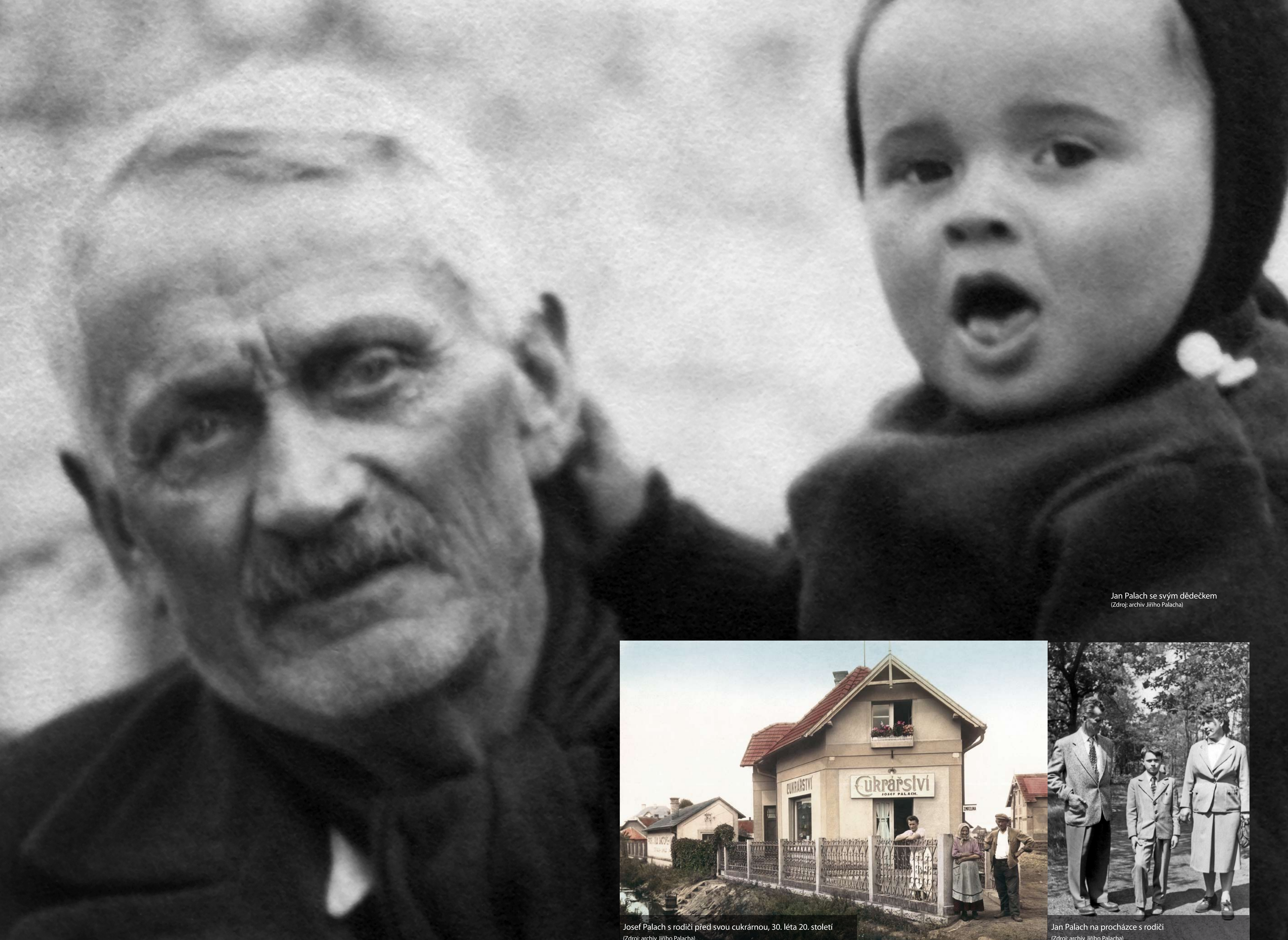
Jan Palach se svým dědečkem