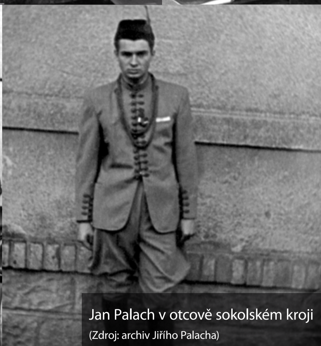
Jan Palach v otcově sokolském kroji