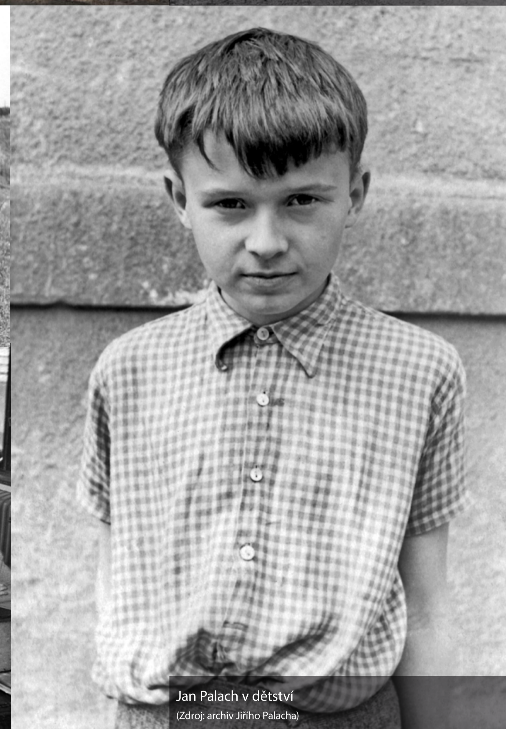
Jan Palach v dětství