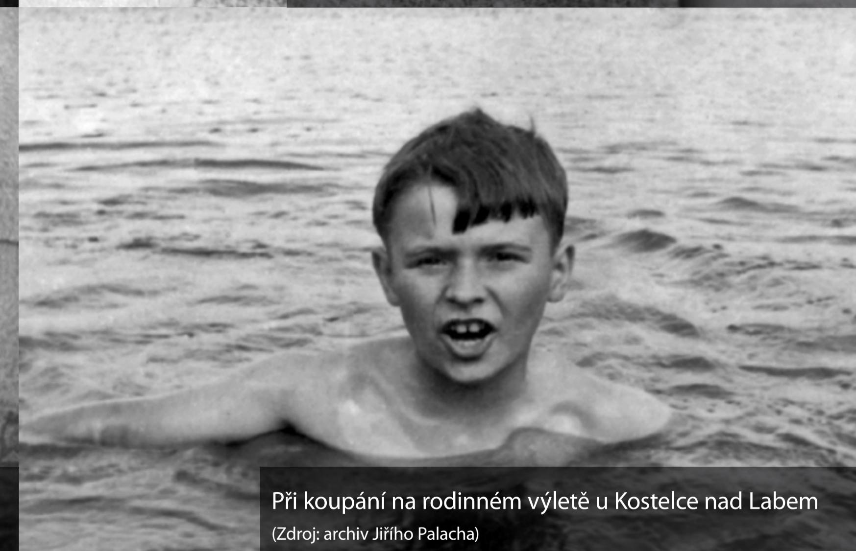
Při koupání na rodinném výletě u Kostelce nad Labem