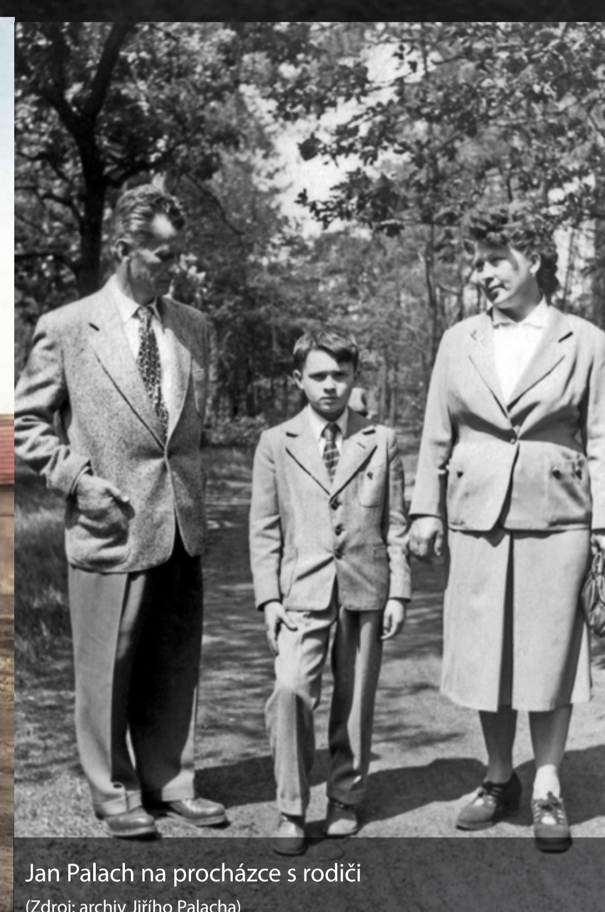
Jan Palach na procházce s rodiči