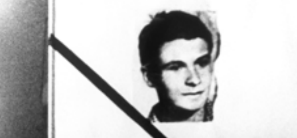
Náměstí Krasnoarmějců před Filozofickou fakultou UK bylo 20. ledna 1969 spontánně přejmenováno na náměstí Jana Palacha