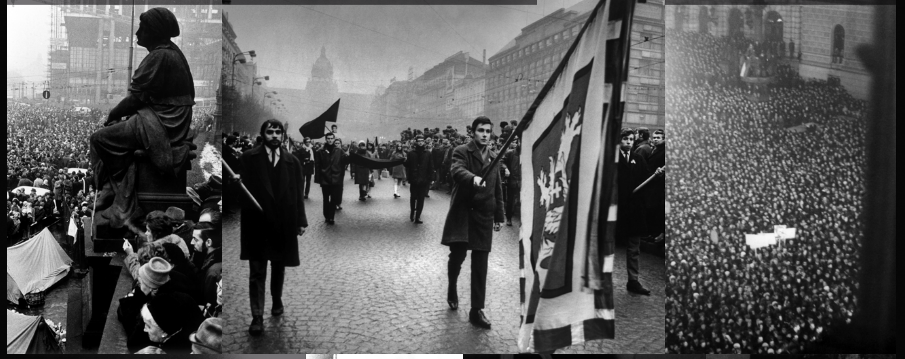
Účastníci pietního průvodu v Praze, 20. leden 1969