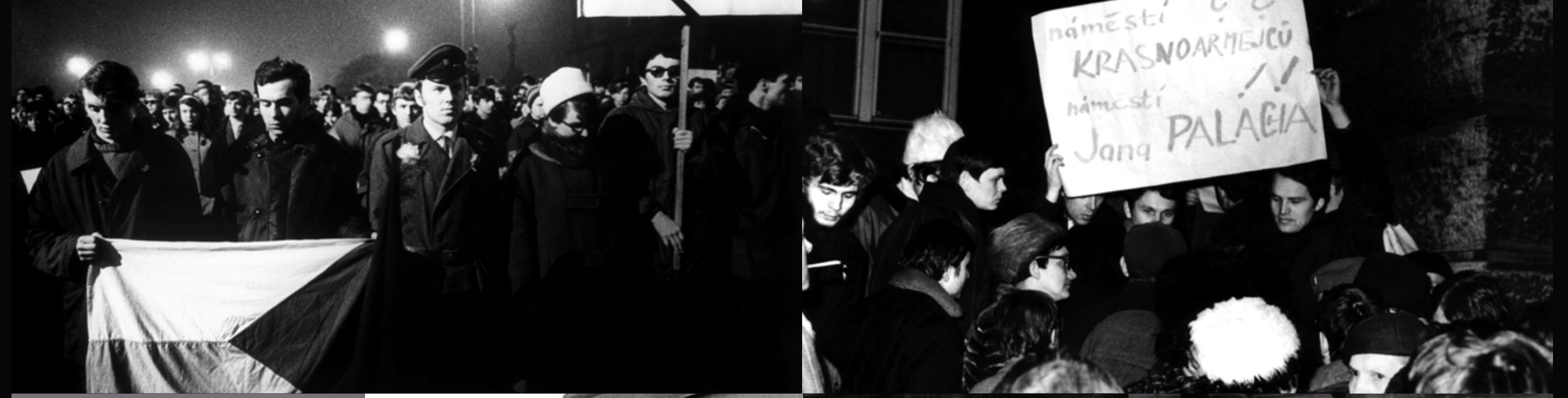
Již o pár dní později bylo náměstí označeno smaltovanými cedulemi. Ty však byly zanedlouho odstraněny