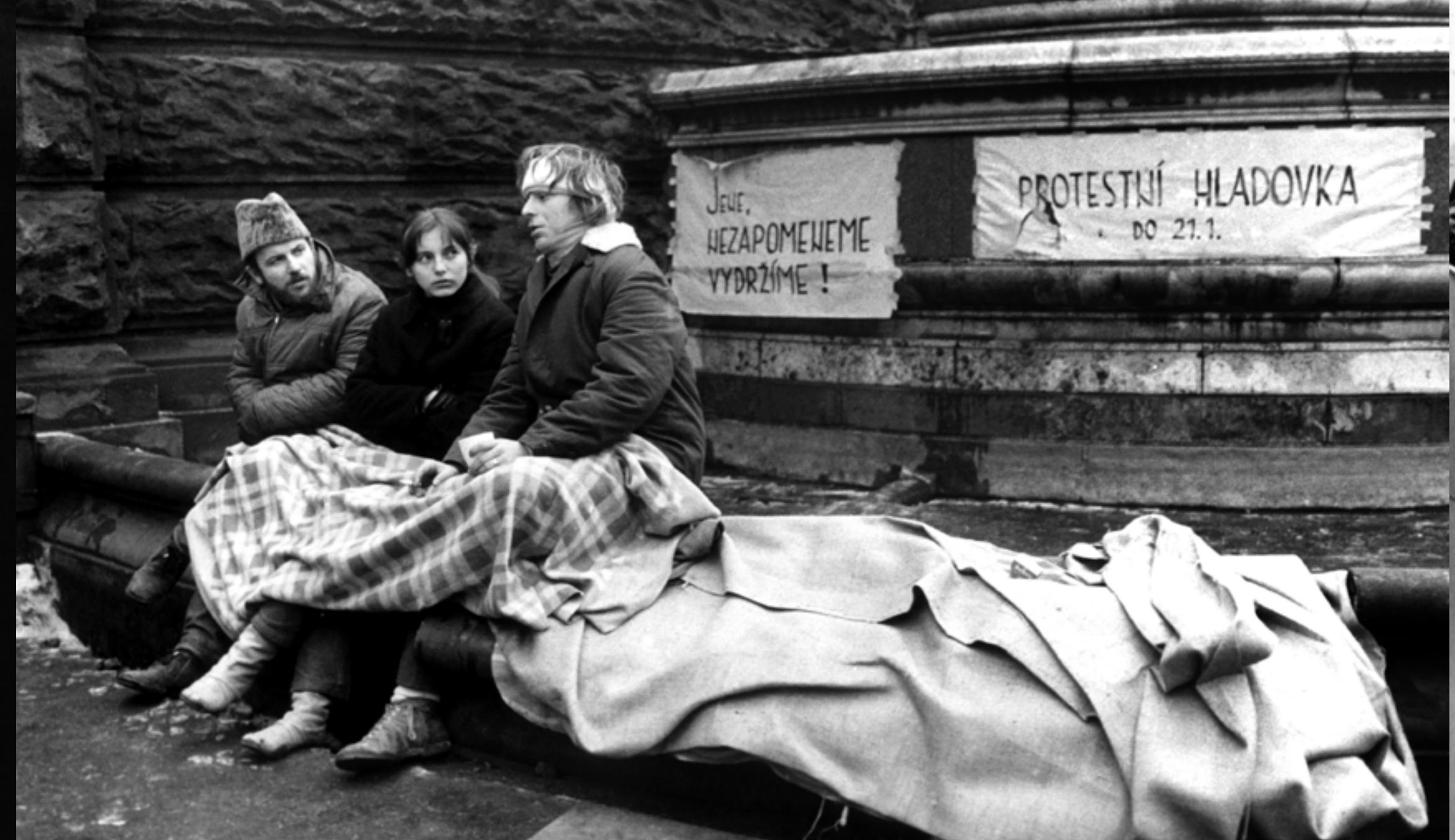
Jeden z účastníků hladovky