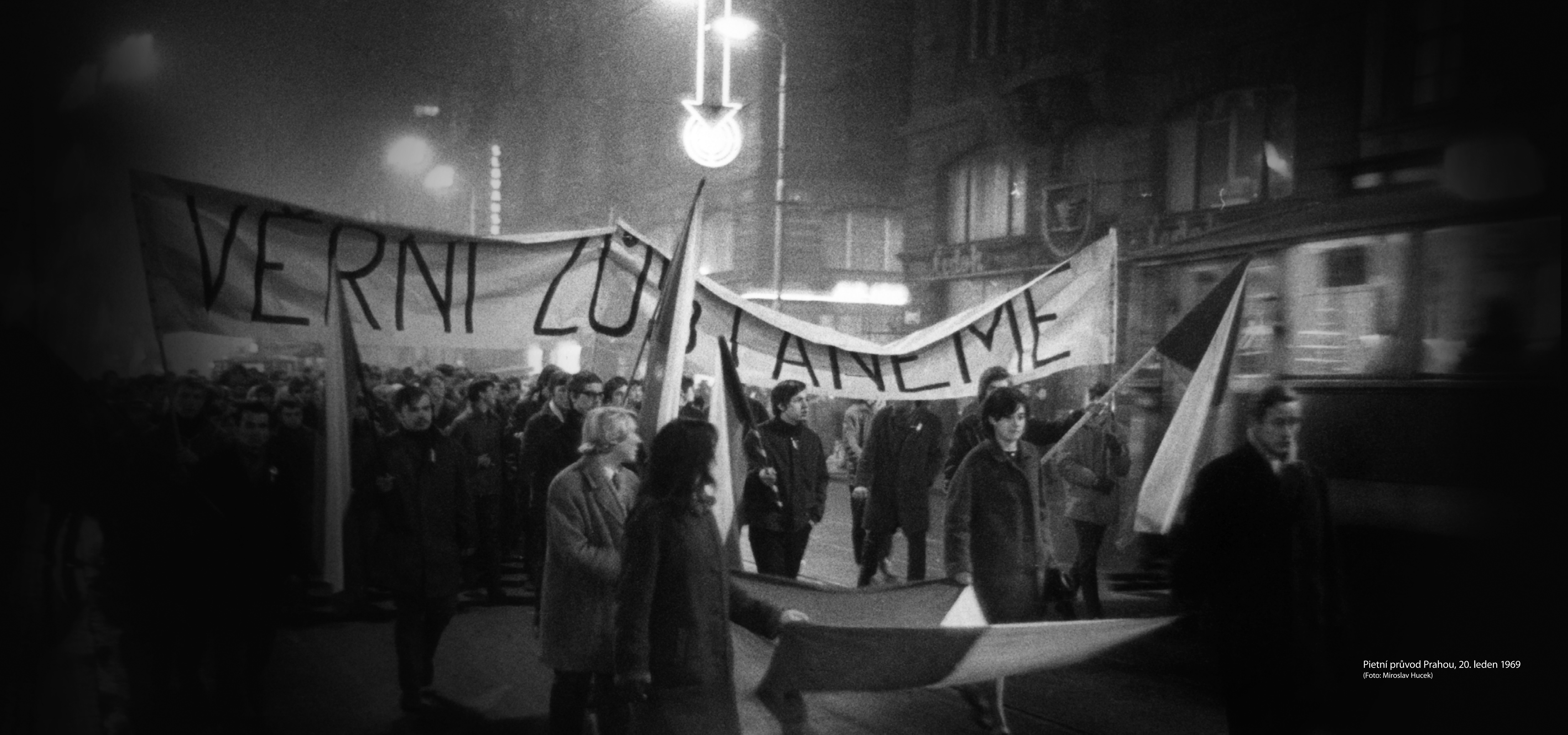
Pietní průvod Prahou, 20. leden 1969