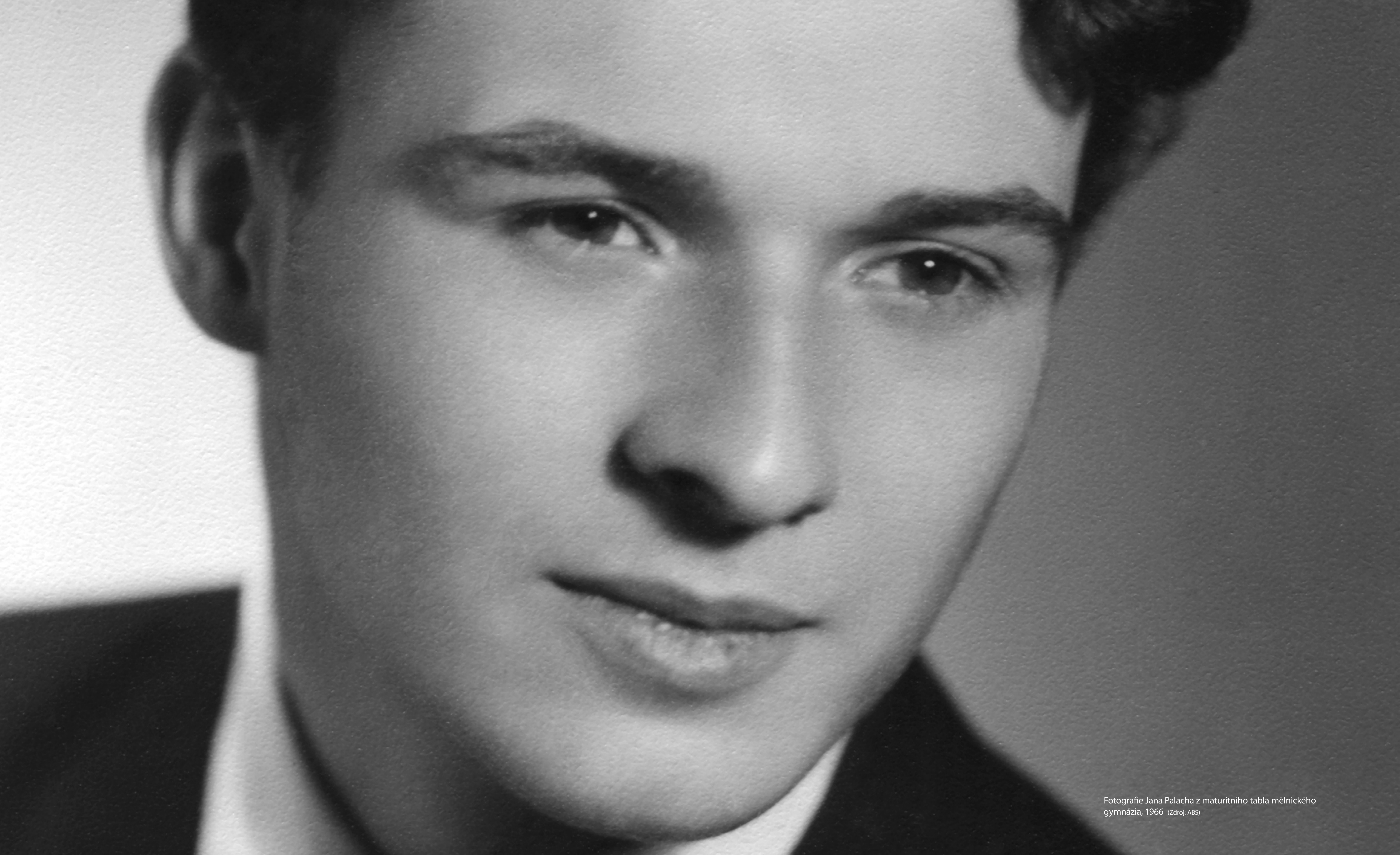
Fotografie Jana Palacha z maturitního tabla mělnického gymnázia, 1966