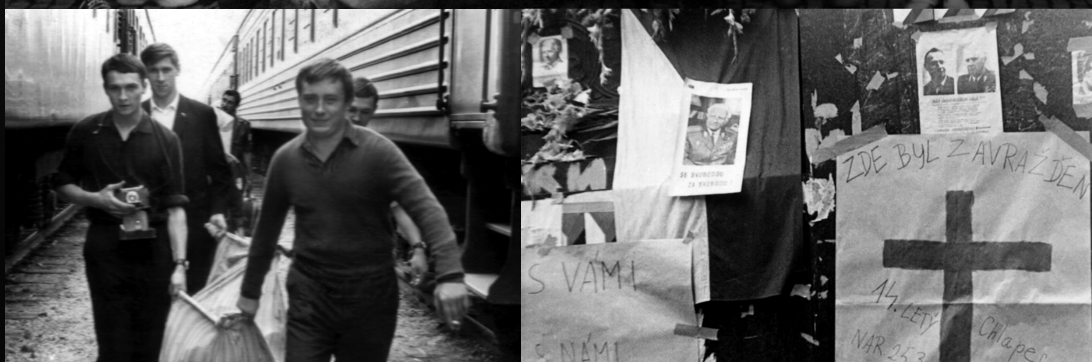
Jan Palach (vlevo s fotoaparátem) na studentském zájezdu v Sovětském svazu, 1967 Zpráva o chlapci zabitým okupačními vojáky umístěná na podstavci sochy sv. Václava. Jan Palach ji vyfotografoval 22. srpna 1968