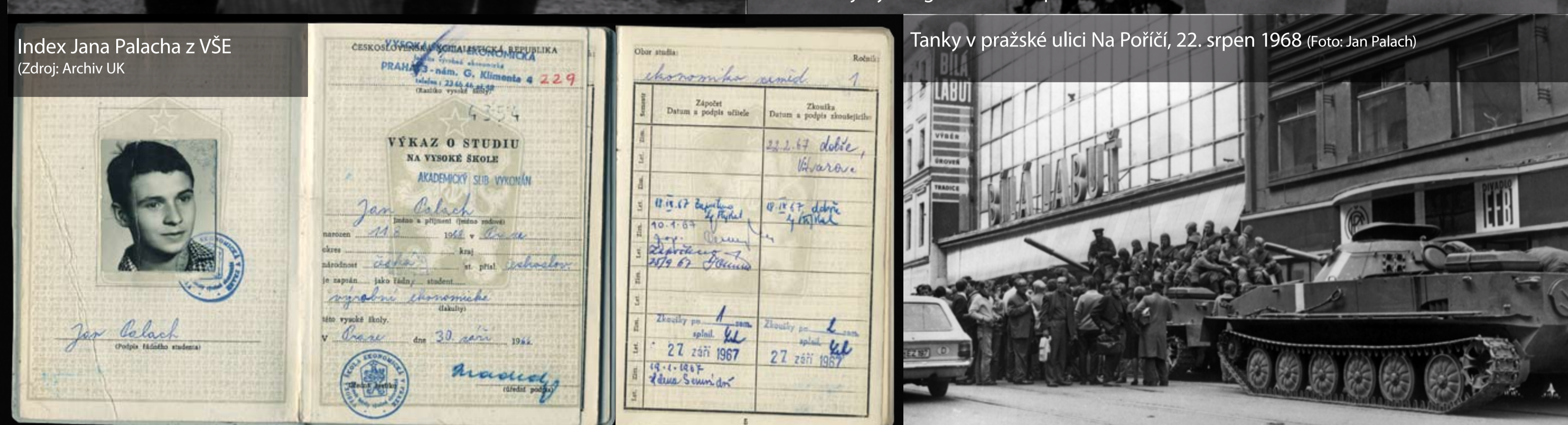
Index Jana Palacha z VŠE Tanky v pražské ulici Na Poříčí, 22. srpen 1968