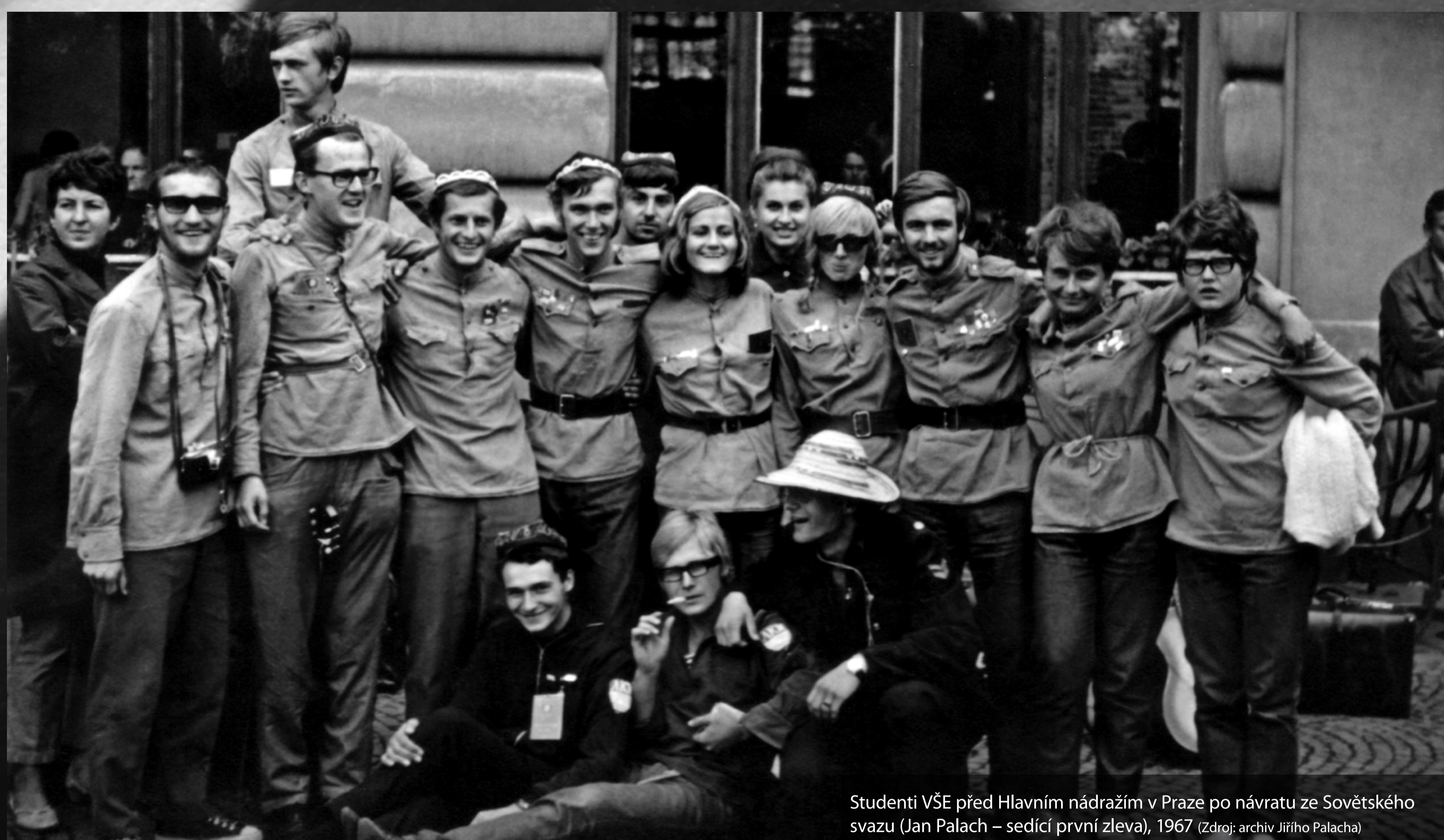
Studenti VŠE před Hlavním nádražím v Praze po návratu ze Sovětského svazu (Jan Palach – sedící první zleva), 1967

Začátkem října 1968 se Jan Palach poprvé podíval na Západ. Za organizaci brigády v SSSR získal zájezd do Francie, kde pomáhal při sběru hroznů. Do Československa se vrátil 19. října 1968, tedy přesně den poté, co Národní shromáždění schválilo smlouvu o dočasném pobytu sovětských vojsk.